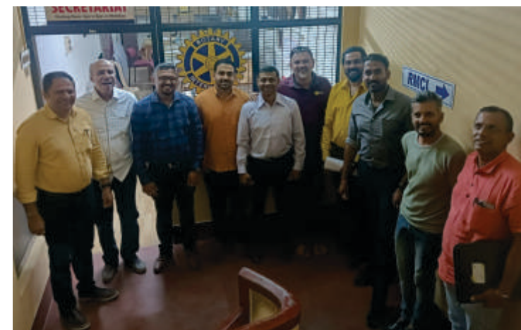
Pre-induction talk to prospective members